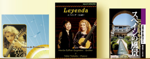
会場にてマリア・エステル new CD 発売予定

音楽家の血筋を引き継ぐマリア・エステルはセビーリャに生れ、4歳で同地のロペ・デ・ベガ劇場でデビュー。11歳でスペイン国営放送局主催の音楽コンクールで優勝し、12歳の時に巨匠アンドレス・セゴビアにその演奏を譲られた。「アンドレス・セゴビア国際ギターコンクール」他、国内外での国際コンクールでの優勝・入賞多数。その後も活発な演奏活動を続け、ヨーロッパ、アジア、アメリカの主要なホールにて演奏、また各地の著名オーケストラとも共演している。1994年アンダルシア音楽賞、また、「フリアン・アルカス」のCDで音楽誌「リズム」より特別音楽賞を受賞。1998年にはセビーリャ音楽協会より、音楽家生活25周年(結婚式)を表彰された。現在、演奏活動の傍ら、サン・フランシスコ・デ・パラウ音楽院にて教鞭をとり、海外でも多くのマスタークラスを行っている。2002年にセビーリャのサンタ・イサベル・デ・フングリア王立アカデミーの会員に任命。最近では、バレンシア音楽堂にて芸術文化功労賞を受賞し、2012年末にはリナレス市のアンドレス・セゴビア財団より、アンドレス・セゴビア賞のメダルを授与されている。日本には、1988年からのツアーが毎年恒例になっており、これまでに1枚のレコード、26枚のCD、4本のビデオ、DVD「レイエンダー〜伝説〜」など多数。2015年、自身の編曲による楽譜集を多数出版、好評発売中。